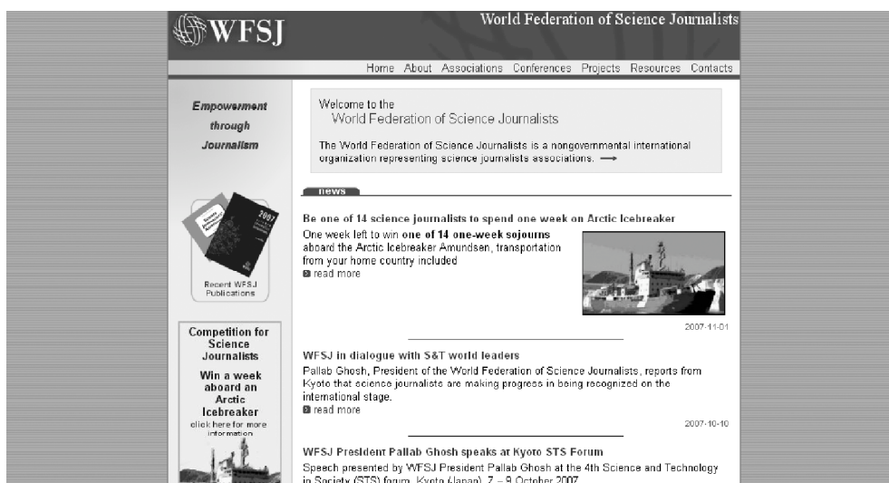
Figura 4 Sitio web de la WFSJ

La sección de sitios web contiene una breve lista de enlaces a recursos muy interesantes.