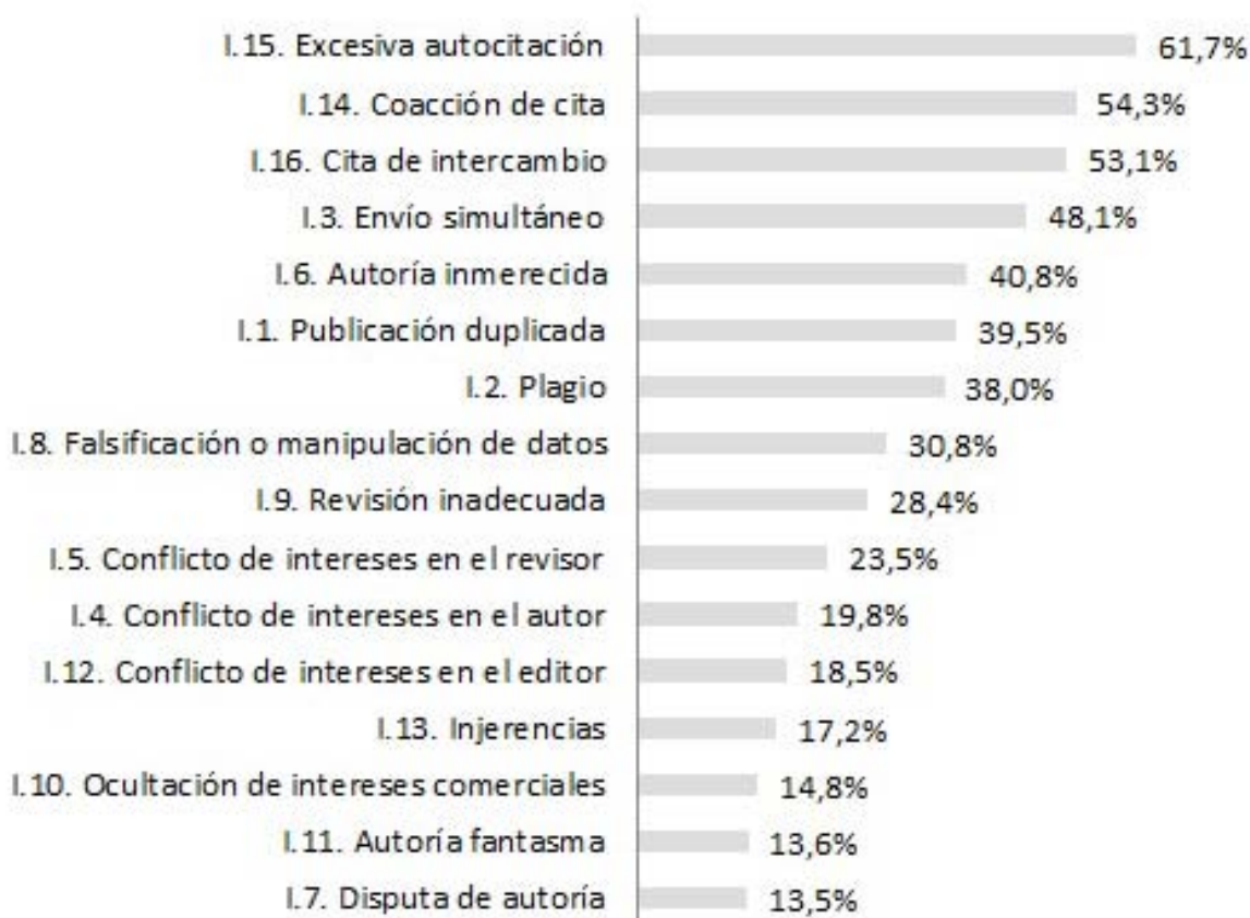
Figura 4. Tendencia futura de crecimiento de malas praxis

Este estudio permite construir una visión aproximada de la ética en las publicaciones científicas españolas de Educación, Psicología y Comunicación,