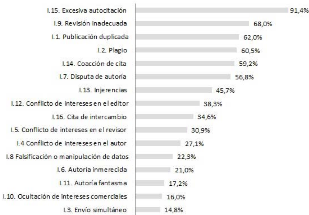
Figura 1. Facilidad de identificación de malas praxis

Los editores destacan especialmente graves la falsificación o manipulación de datos , la revisión inadecuada y el plagio en un porcentaje que supera el 92%. La menor varianza (0,42) en la respuesta de los editores se concentra en la revisión inadecuada . En todos estos casos sería necesaria la intervención del editor teniendo que publicar en su revista incluso retractaciones de los artículos. Si bien todas las malas praxis son ratificadas por los editores como graves, es digno de mención que la cita de intercambio solo reciba un 34,6%. Una media del 27,9% responde "no sabe, no contesta", es decir, atendiendo al promedio cercano, 1 de cada 3 editores no se pronuncia sobre la gravedad de los diferentes casos de mala praxis (figura 3).